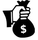
Rüşvet ve Kara Para Aklama Kanıtı

HERHANGİ bir devletin vahşi yaşamı koruma kanunlarının ihlaline dair bilgisi olan kimselerin, bu bilgilerinin güvenli bir şekilde ele alınmasını sağlamak için yasal temsilciye başvurmaları önemle tavsiye edilmektedir.